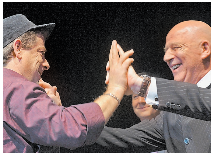
Michael Hirte (links) – der Mann mit der Mundharmonika – mit seinem Paten Alexander Goebel.